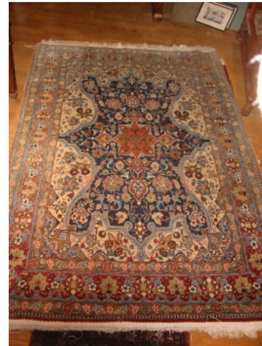
Ghom Brücke 140 x 200 cm

Nach telefonischer Anmeldung zu besichtigen bei: