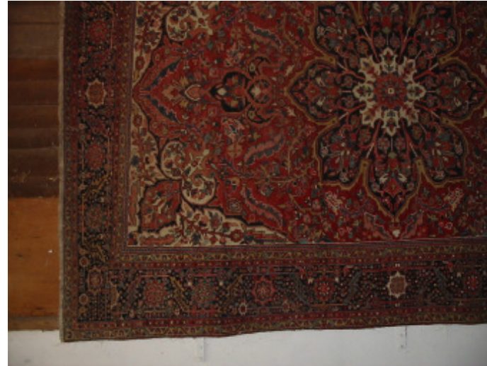
Heris 300 x 400 cm