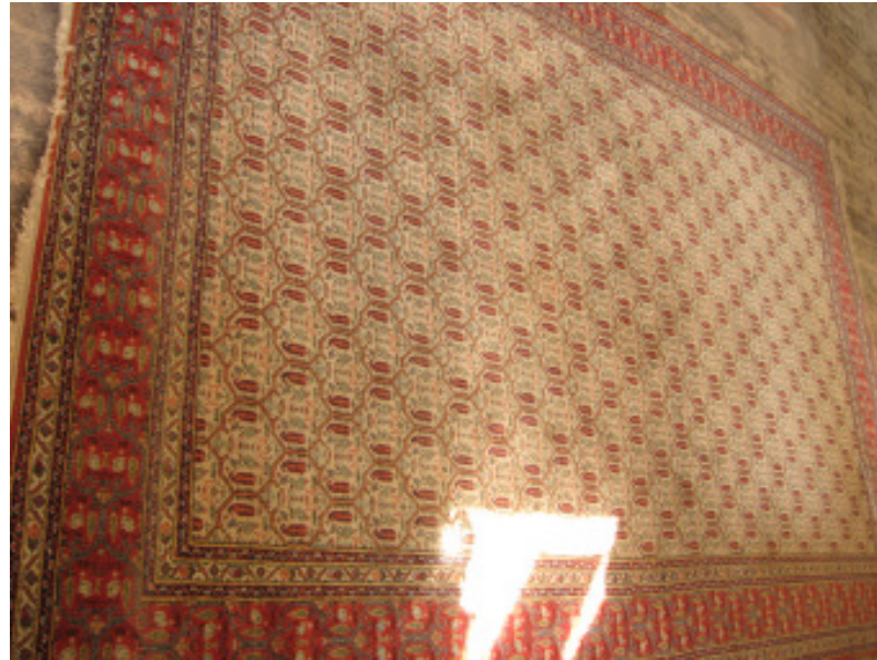
West-Persien „Mai-Mai“ ca. 1930 210 x 320 cm