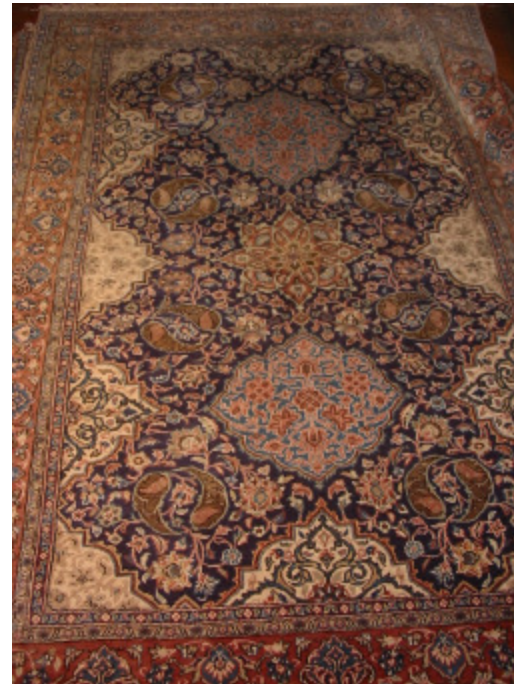
Ghom Brücke 140 x 200 cm