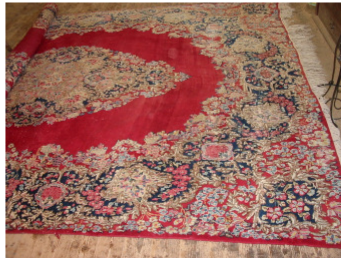
Kirman 300 x 400 cm