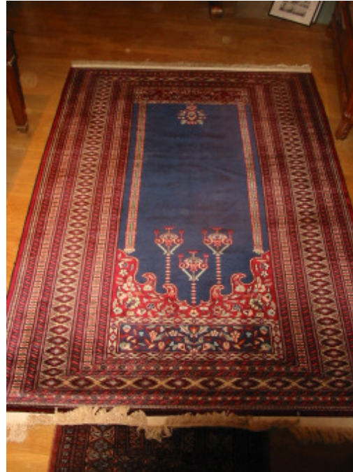
Gebetsteppich Pakistan 130 x 200 cm