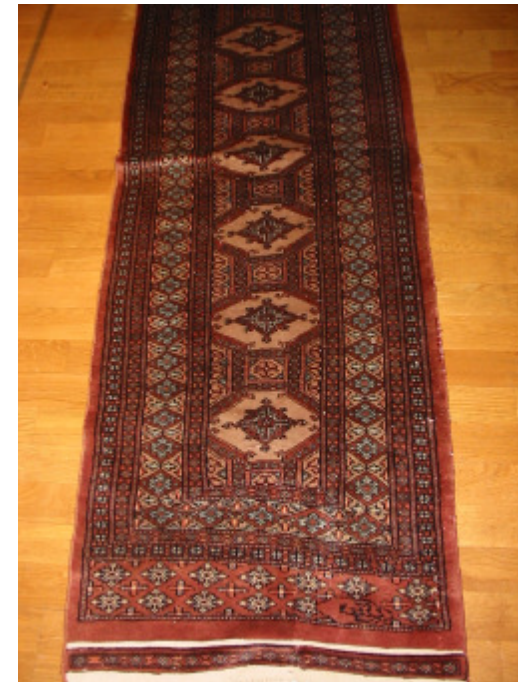
Läufer Pakistan 60 x 200 cm

Nach telefonischer Anmeldung zu besichtigen bei: