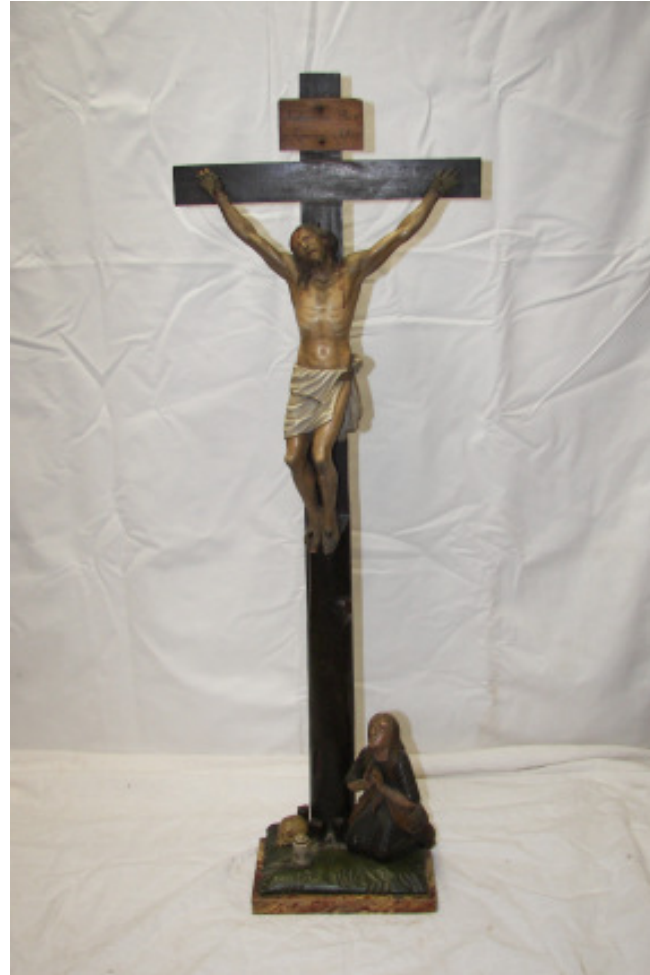
Christus, süddeutsch, gefasst, um 1700