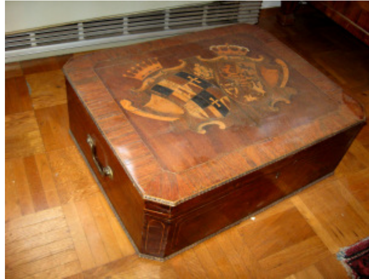
Hochzeitsschatulle mit Allianz-Wappen