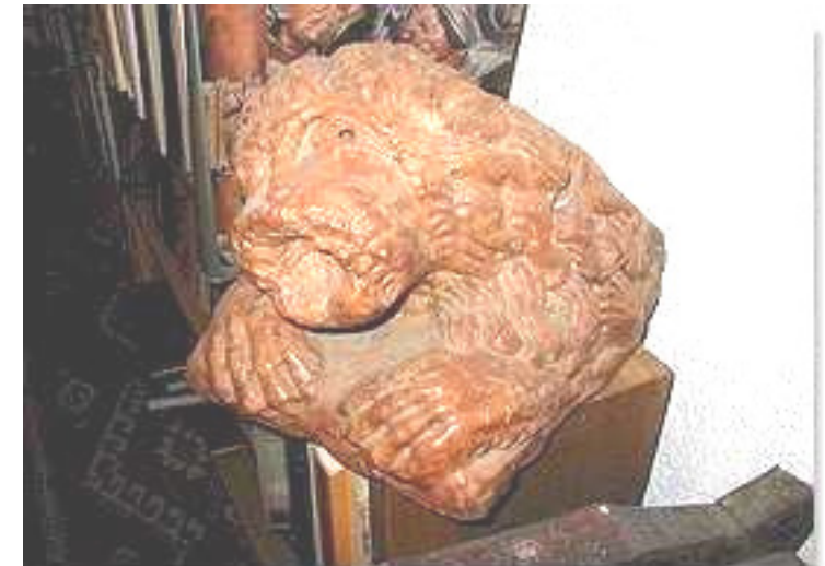
Löwe, Marmor, Verona, 17. Jahrhundert