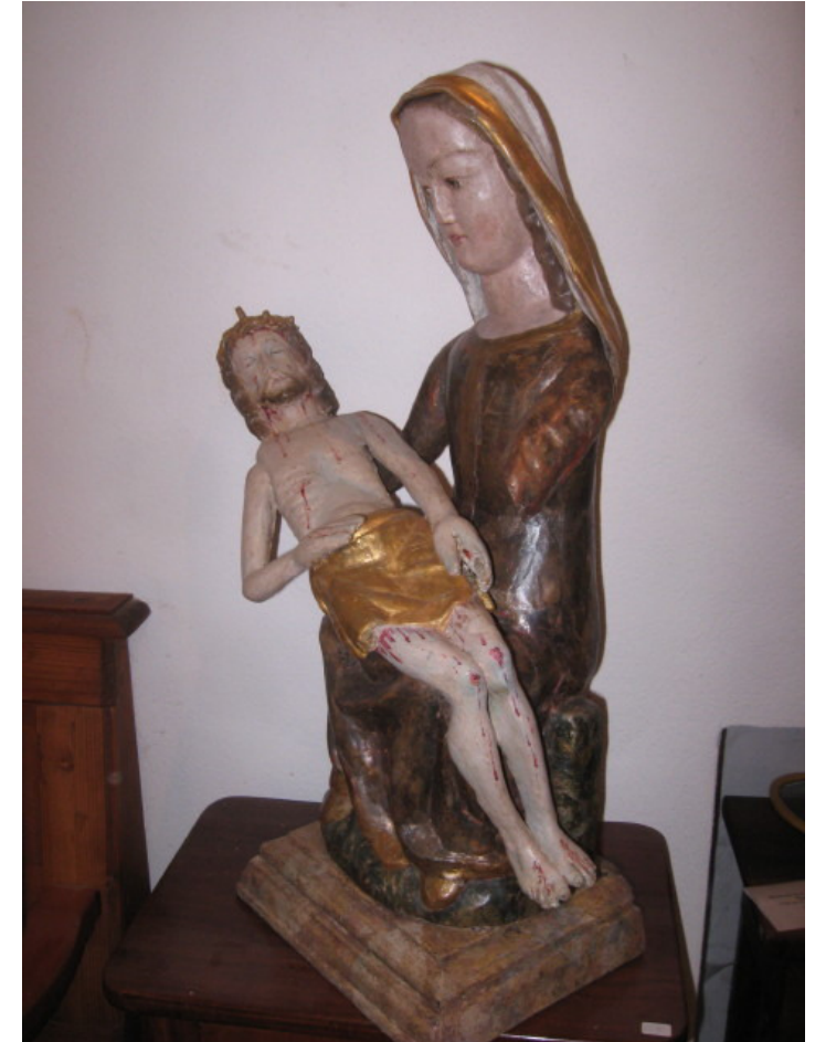
Pietà, um 1400