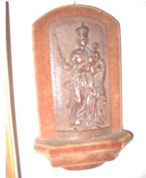
Madonna mit Kind, Buchsbau, wohl Frankreich um 1700