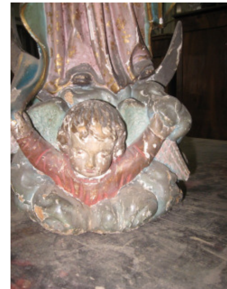
Maria (wohl Südfrankreich) frühes 19. Jh.