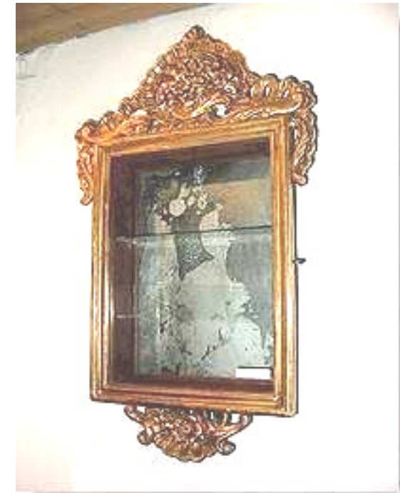
Vitrine, Holz geschnitzt, vergoldet, 18. Jahrhundert