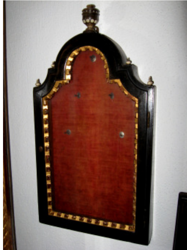
Wahrscheinlich Schlüsselkästchen, um 1700