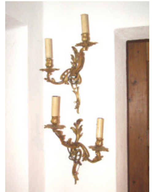
Ein Paar Wandappliken, Bronze, französisch, um 1860/70