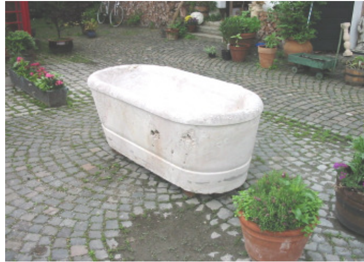
Römische Badewanne, weißer Marmor, etwa 1800 Jahre alt