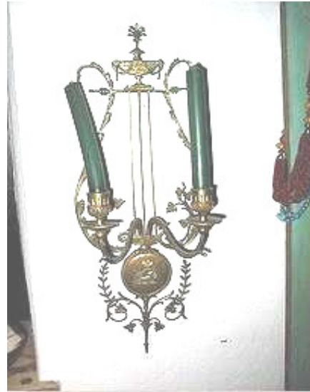
Ein Paar Wandappliken, Bronze