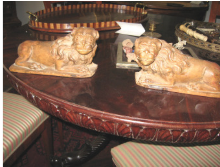
Löwen-Pärchen, Lindenholz, etwa Mitte 17. Jhd.