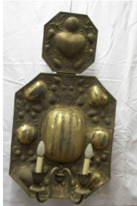
Ein Blaker von insgesamt 4 Messing getrieben, 19. Jhd. H 90 cm B 49 cm