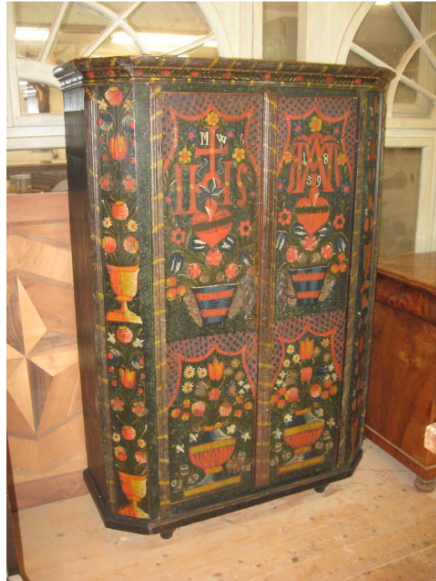
Tölzer Bauernschrank, 1839 H 164 x B 110 x T 44 cm

Werkstätte für Restaurierungen Ulrich Grams 81247 München Faistenlohestraße 44 Tel: +49-89-594452 Fax: +49-89-89197989