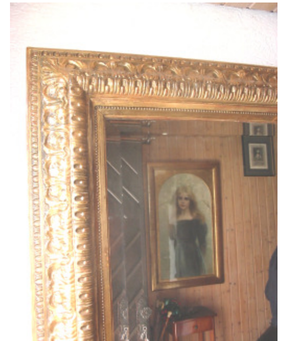
Großer Stuck-Spiegelrahmen um 1820