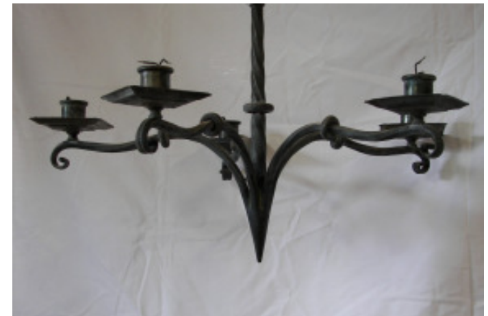
Leuchter, Eisen geschmiedet, 5-armig H ohne Kette 45 cm, Durchmesser 66 cm