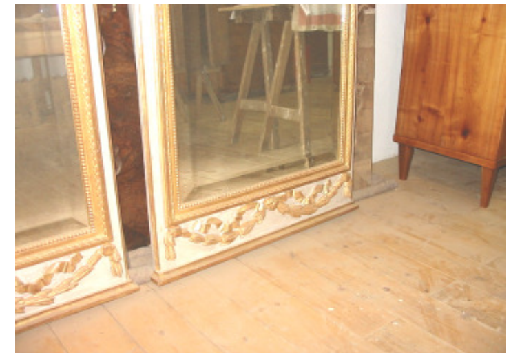
2 Louis-Seize Trumeau geschnitzt, gefasst und vergoldet