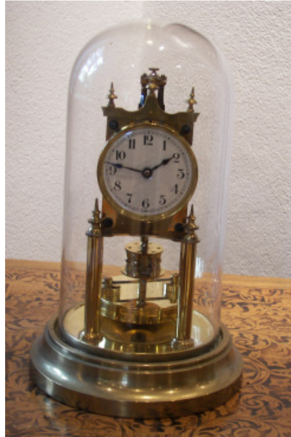
Skelett-Uhr, etwa 1860