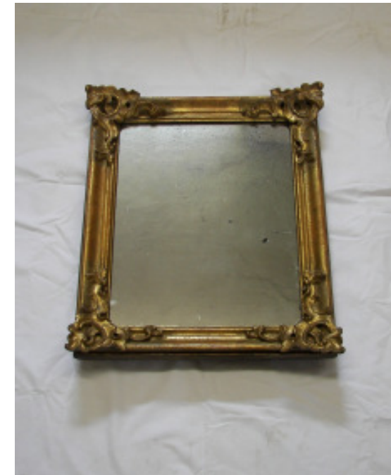
Rokoko-Spiegel, geschnitzt Originalfassung