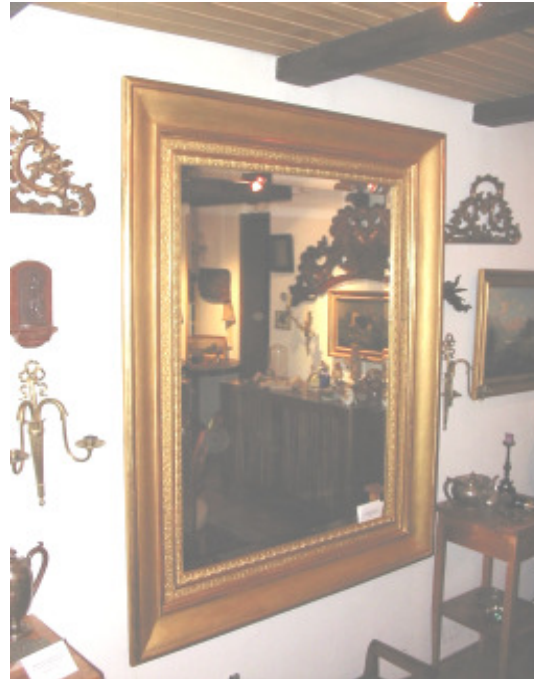
Spiegelrahmen um 1820, neu vergoldet