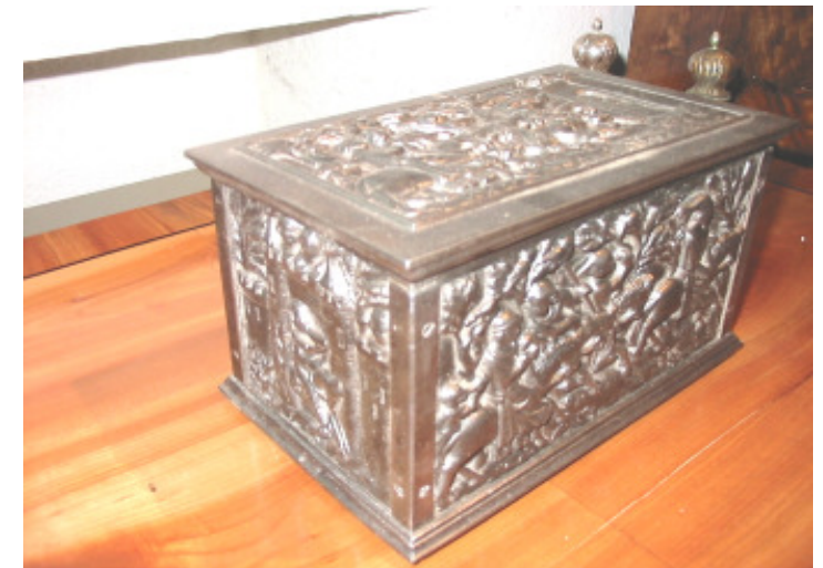
Kassette, feinsten Eisenguss im Stil der Gotik, 19. Jhd.