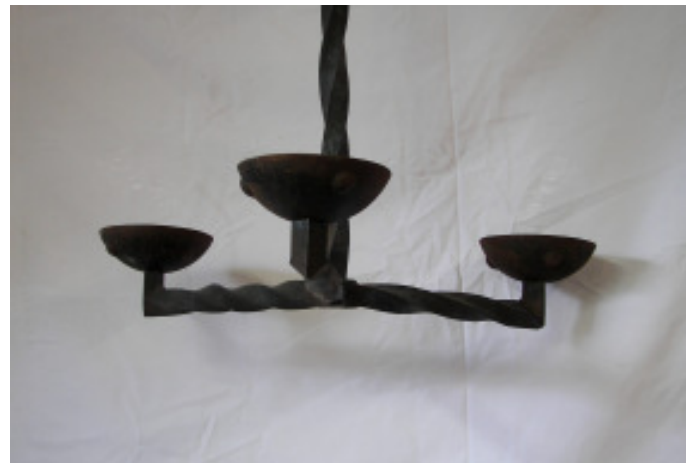
Leuchter, Eisen geschmiedet, 3-armig H 50 cm Durchmesser 60 cm