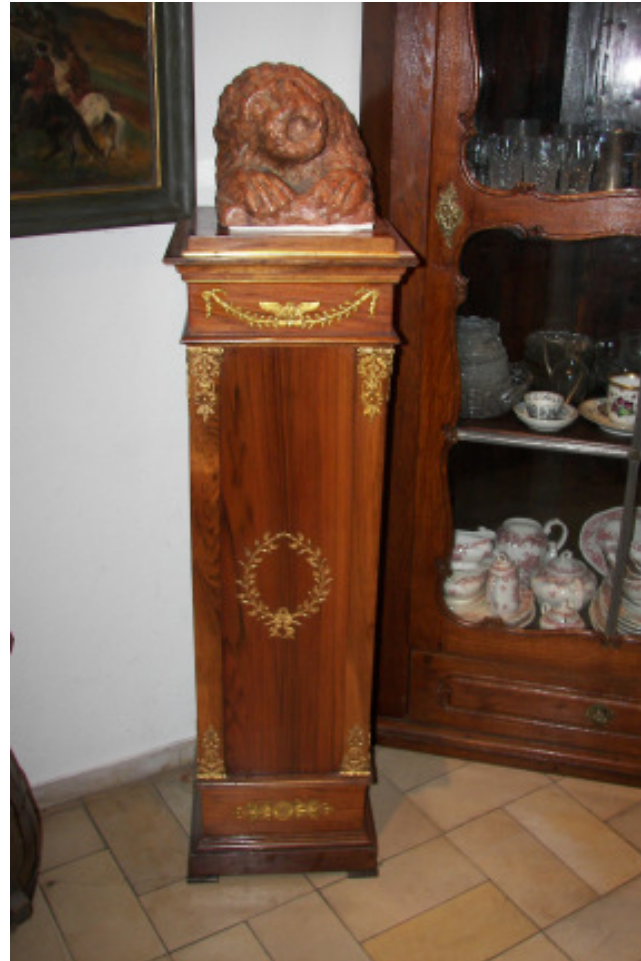
Säule, Nussbaum mit Bronzeapplikationen 19. Jahrhundert H 120 x 32 x 32 cm