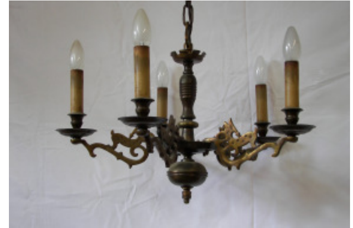
Bronzeleuchter, 5-armig, H ohne Kette 40 cm Durchmesser 55 cm