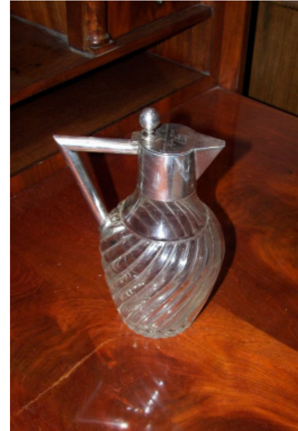
Glaskaraffe mit Silbermontierung