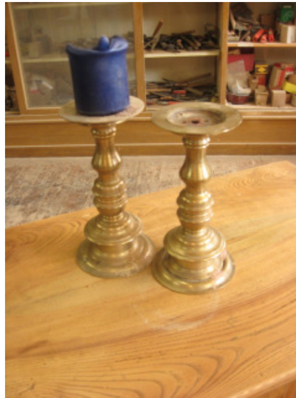
2 Leuchter Bronze frühes 17 Jh.