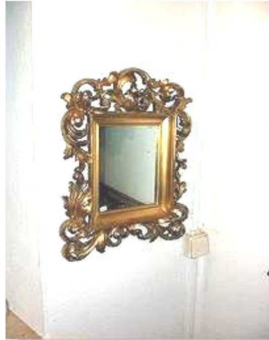
Barockspiegel, Holz geschnitzt, vergoldet, 19. Jahrhundert