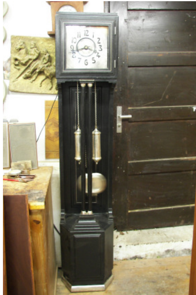
Vereinigte Werkstätten für Kunstgewerbe Raumkunst Dresden Eiche ebonisiert Gewichte und Perpendikel , Sockelleiste, Bandeinlagen versilbert mit Schlagwerk H 195 x B 38 x T 30 cm