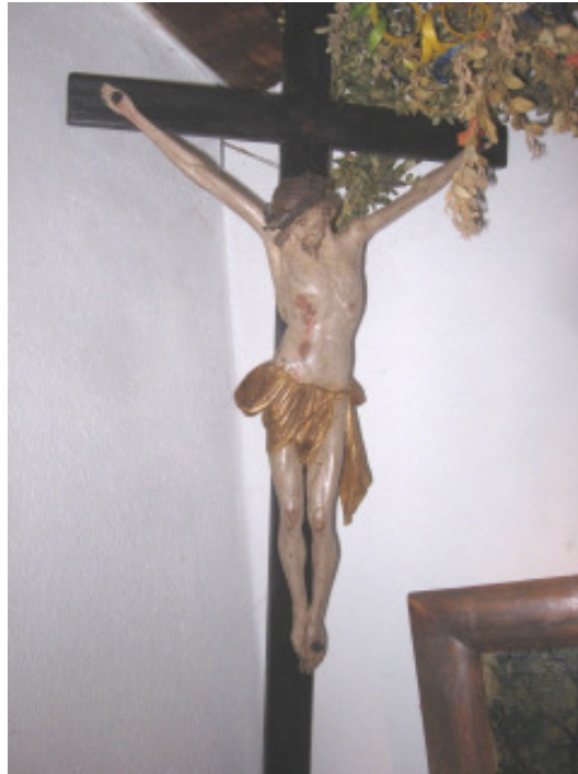
Christus, süddeutsch ca. 1730