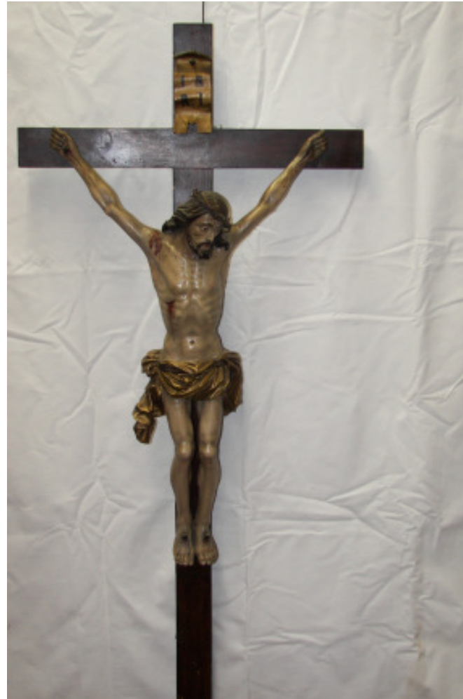
Christus, süddeutsch, gefasst, um 1800