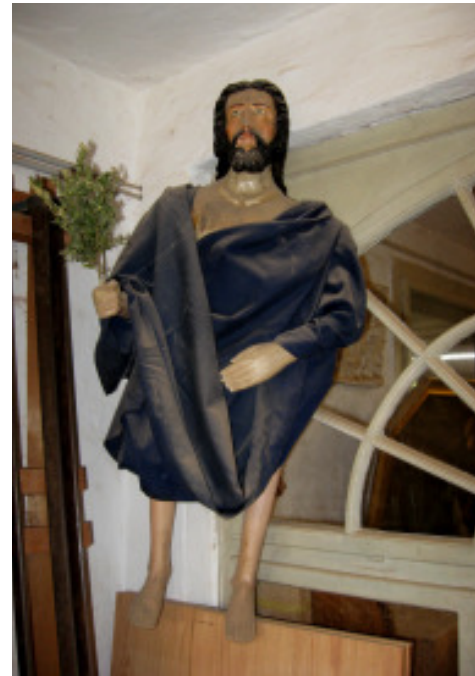
Palmesel-Christus, 19. Jhd. südländisch