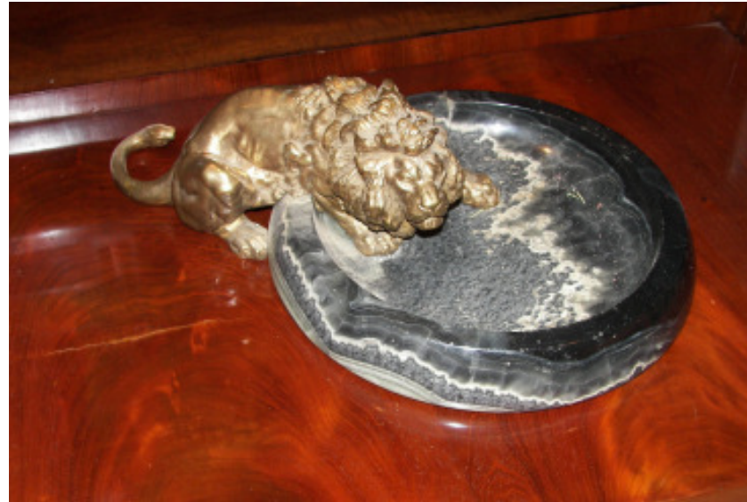
Bronzelöwe auf Achatschale, signiert Titze