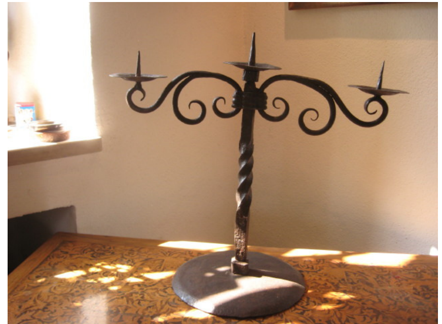
Eisenleuchter, um 1600