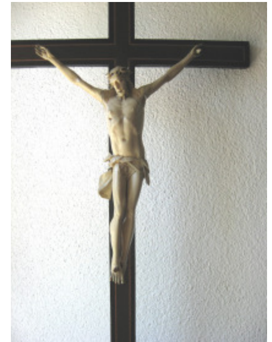
Elfenbein-Standkruzifix, etwa 1650