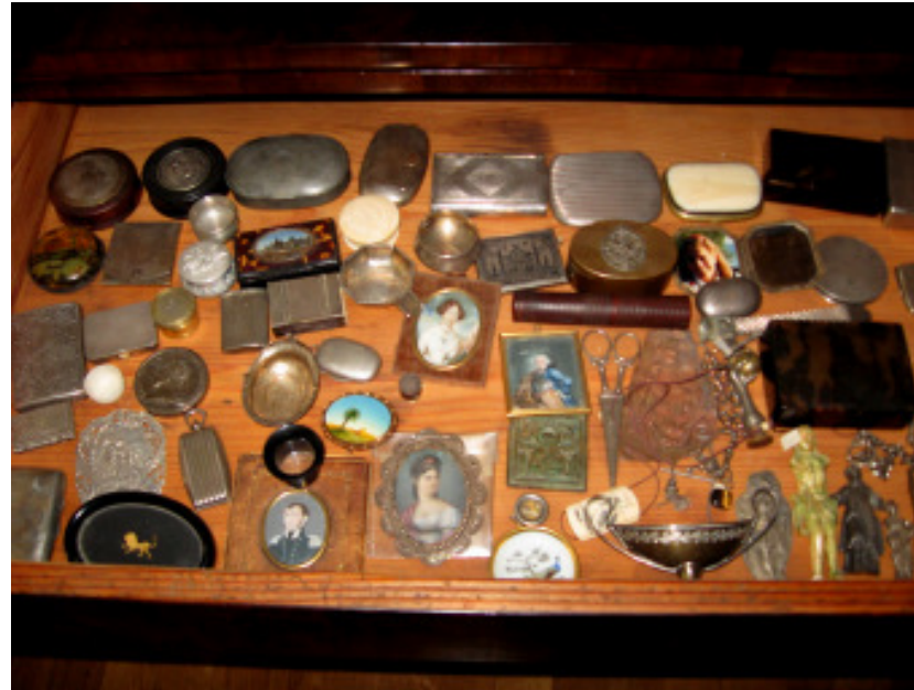
Kleine Auswahl an Varia