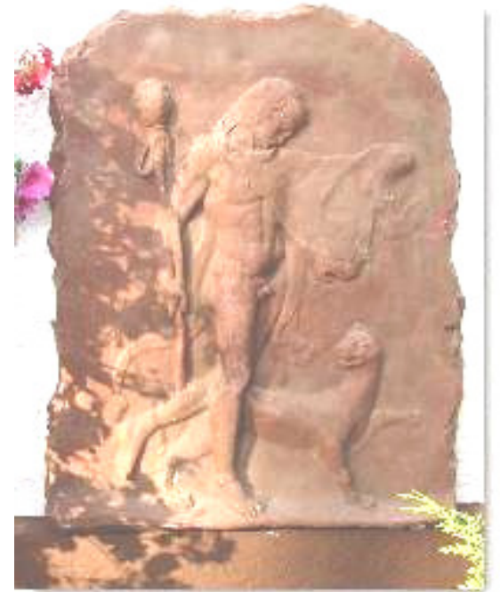
Gipsrelief (Herakles ?) Abguss (farbliche Änderung möglich)