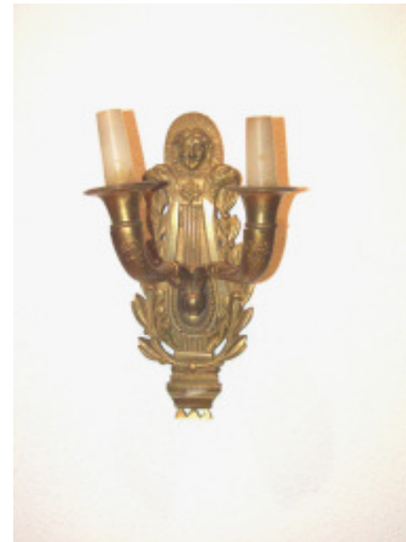
2-armiger Wandleuchter, Bronze, um 1810