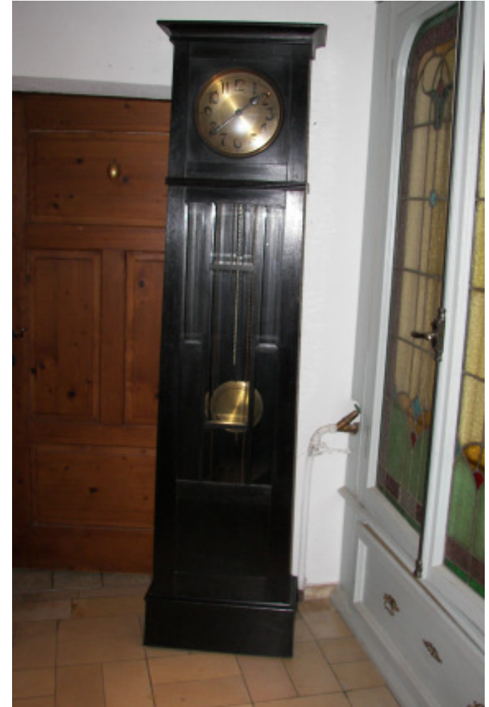
Standuhr um 1900 mit Schlagwerk H 205 x B 45 x T 23 cm